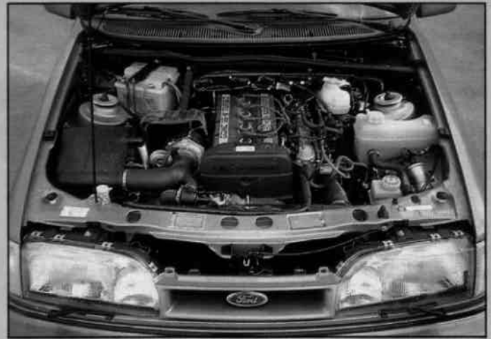
Moottori näyttää päällisin puolin olevan jokseenkin ennallaan, mutta todellisuudessa 60 % osista on suunniteltu uudelleen. Samalla teho on kasvanut 204:stä 220:een horseen lylyttömällä bensalla ja katalysaattorilla.

Lisäksi liikennevaloissa sutimiseen kylästyneet kaksivetoisten Cossyjen kuskit vaihtavat pian nelivetoon ja kostavat kaikki talvelin kiihdytystappiot. Nelivetoisessa ei nimittäin ole pienintäkään merkintää siitä että tämä raapii joka kilmasta.